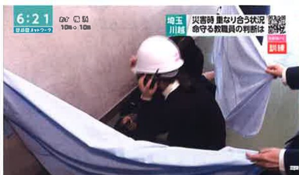
トランシーバーで安否確認