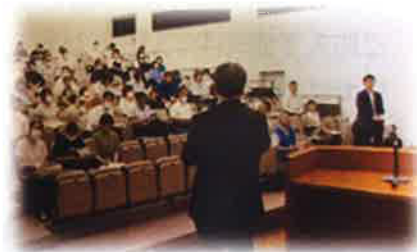
“講師の熱弁に引き込まれ”